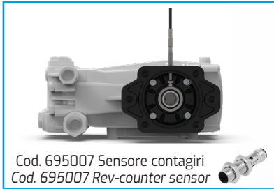
Cod. 695007 Sensore contagiri Cod. 695007 Rev-counter sensor

Tutti i modelli di Pompe della Serie C MI sono disponibili con certificazione ATEX, su richiesta. Upon request, all models of C MI pumps series are available with ATEX certification.